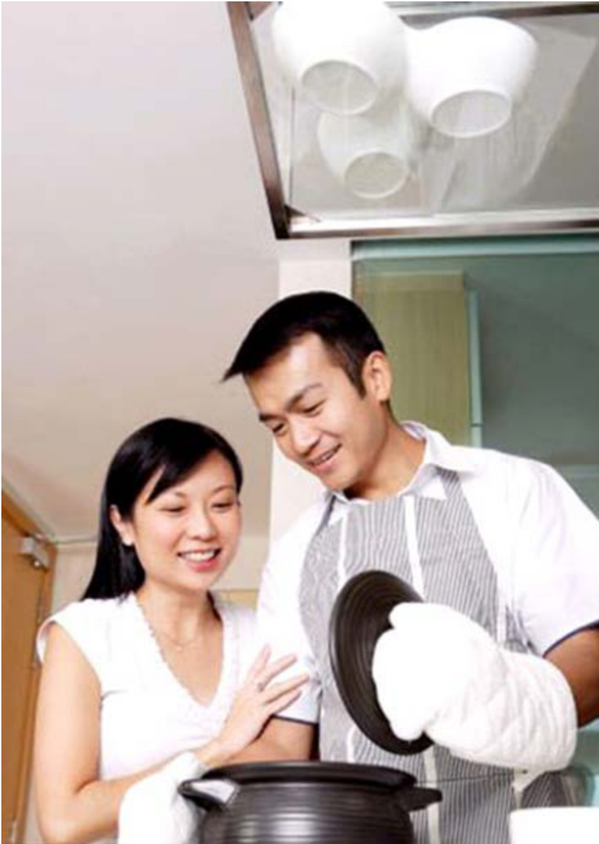
Hình ảnh bài Vợ tôi - cô ấy là người đẹp nhất trên mục Tình yêu - Hôn nhân , trang afamily.vn , ra ngày 18/10/2008

show “ Mỗi tuần một chuyện - Đối thoại với Lê Hoàng ” rằng để thay đổi tình trạng này cần phải có sự tham gia của cả đàn ông, phụ nữ?