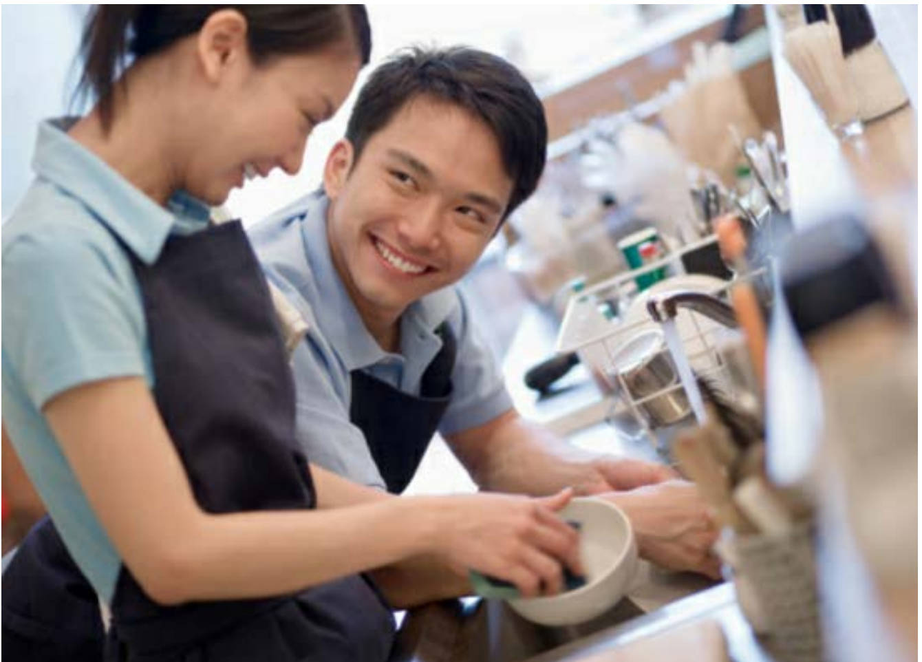
Hình ảnh bài Việc nhỏ mỗi ngày (P8): Giúp vợ làm việc nhà trên mục Tin tức xã hội , trang xahoi.com.vn , ra ngày 20/06/2012

(Trích Tại sao Bình Đẳng Giới tạo ra những bài viết hay và giá trị kinh doanh cho truyền thông - “Sứ mệnh khả thi”: Một công cụ vận động truyền thông và giới)