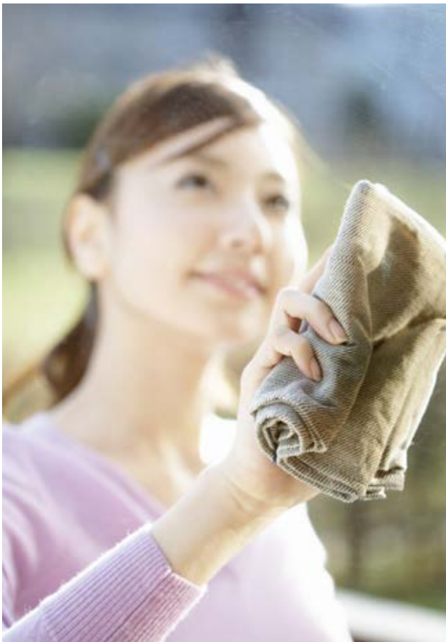
Hình ảnh trong bài 12 Bí quyết dọn nhà đón Tết , trang 22, tạp chí Gia đình trẻ Tết (số 87)

của hình ảnh đối với ý thức của độc giả ra sao. Vì vậy việc lựa chọn hình ảnh minh họa cho bài viết vô cùng quan trọng, hình ảnh là sự bổ sung khiến bài viết trở nên sinh động hơn và được thể hiện một cách trọn vẹn. Và rất nhiều khi một bài báo không cần quá nhiều lời mà chỉ cần minh họa bằng hình ảnh. Dù trong trường hợp nào, định kiến giới sẽ ngày càng ăn sâu bám rễ nếu hầu hết các bài báo đều lựa chọn hình ảnh minh họa cho công việc thu dọn nhà cửa đón tết là những người phụ nữ.